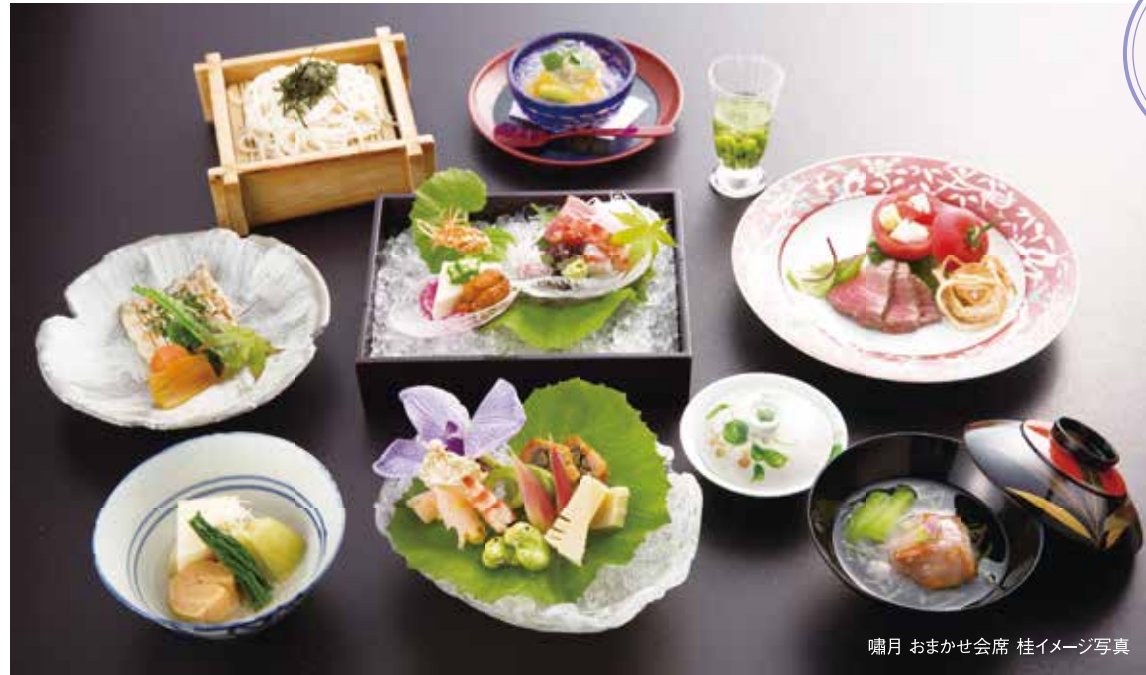
嘯月 おまかせ会席 桂イメージ写真