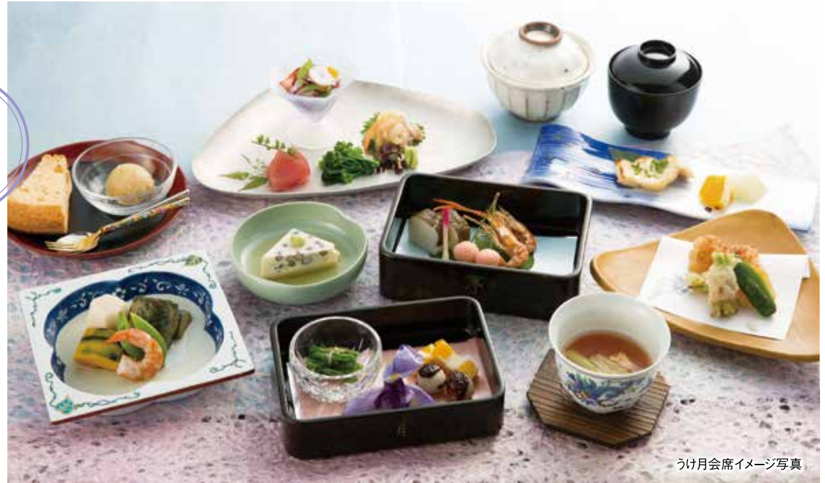
うけ月会席イメージ写真

【先付】水無月豆乳寄せ 小豆 旨味出汁 山葵 【前菜】求肥昆布小袖ずし はじかみ、マッシュポテトと明太子の桜桃見立、石垣南瓜、川海老唐揚、石川小芋田楽焼、アイコ浸し 【椀】トマト摺流し 鶏胸香り焼 はす芋 【造り】蛸 鯛子がらみ 鯖 あしらひ一式 【焼物】鱈酒盗焼 オレンジ塩麹漬 酢取玉葱 【煮物】茄子オランダ 南瓜 スナッパ豌豆 里芋 つの字海老 【揚物】玉蜀黍岩石揚 胡瓜生ハム束ね 青唐 のし梅とチーズの薄衣 【食事】日替わりでご用意いたします 【甘味】旬彩菓